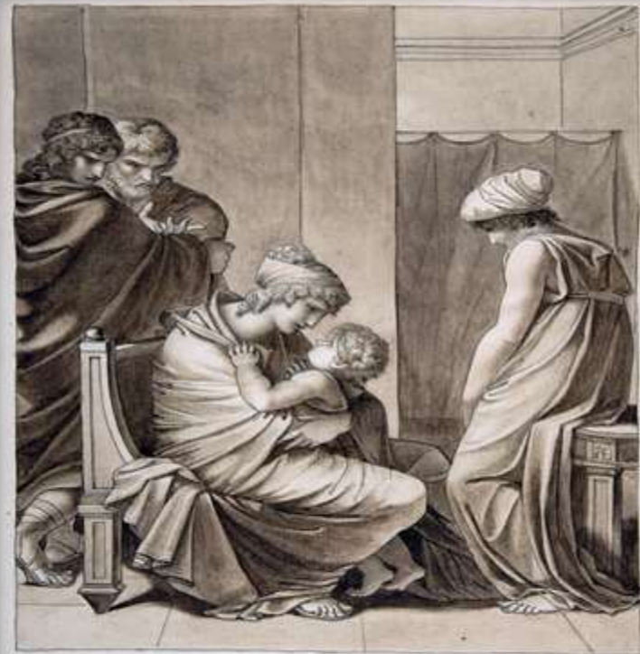
Ein Bild, das die Kunst der Darstellung zeigt von der Kunst der Kunst, die die Kunst der Kunst die Kunst der Kunst, die die Kunst der Kunst die Kunst der Kunst, die die Kunst der Kunst