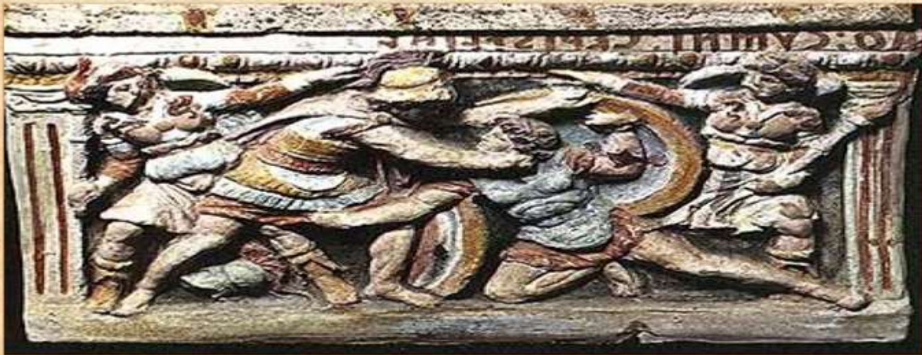
Ετεοκλής και Πολυνείκης αλληλοφονεύονται (ετρουσκικό ανάγλυφο)