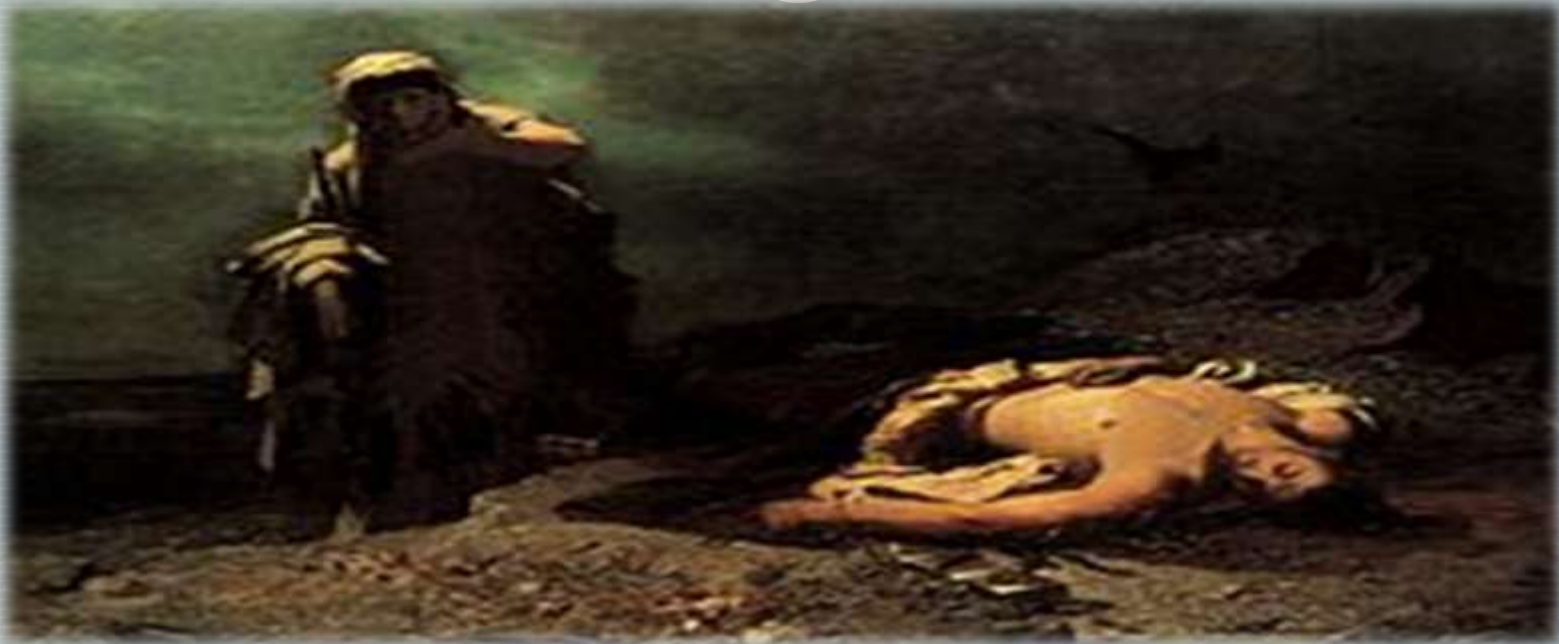
Η Αντιγόνη εμπρός στο νεκρό Πολυνείκη .Νικηφόρος Λύτρας (1865)