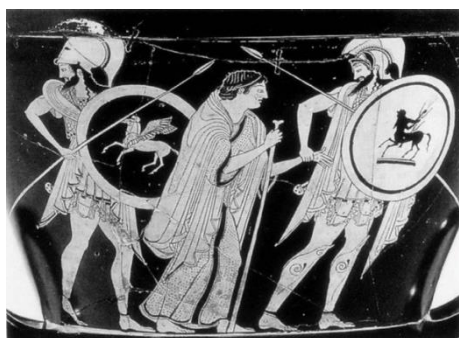
Ο Ακάμας και ο Δημοφών οδηγούν τη γιαγιά τους Αίθρα μετά την πτώση της Τροίας. Ερυθρόμορφος κρατήρας, 500 π.Χ.. Βρετανικό Μουσείο