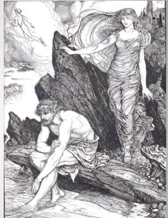
1. Henry Justice Ford, Οδυσσέας και Καλυψώ (1894)

(Πρόσθετες πληροφορίες μέσω υπερσυνδέσμων και οπτικοακουστικό υλικό)