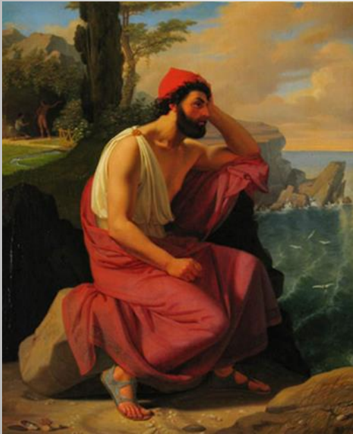
2. Blunck, Detlev Conrad, Ο Οδυσσέας στο ακρογιάλι, 1830

Αρχική διερεύνηση της συναισθηματικής κατάστασης του Οδυσσέα.