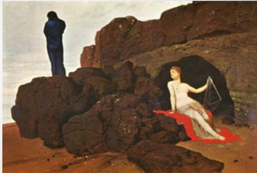
3. Arnold Böcklin, Οδυσσέας και Καλυψώ, 1883