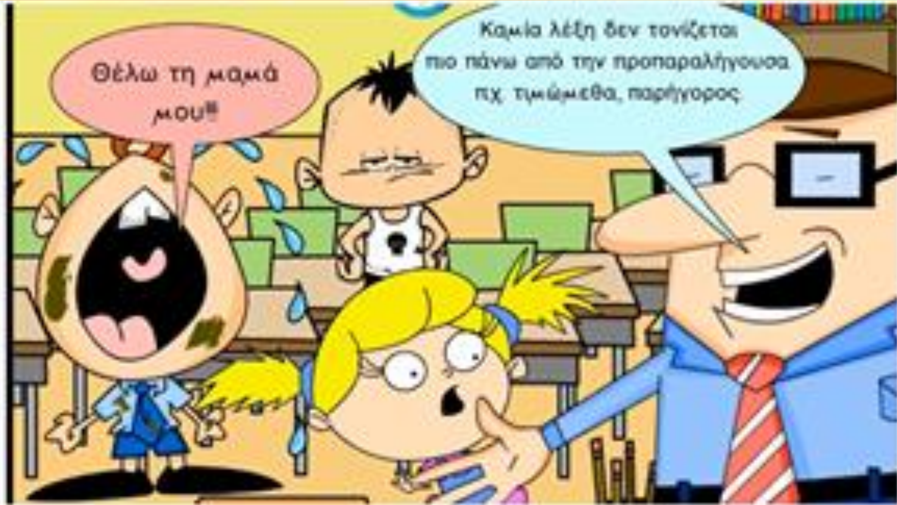
Αρχαία Ελληνική Γλώσσα Α' Γυμνασίου. Κανόνες τονισμού.