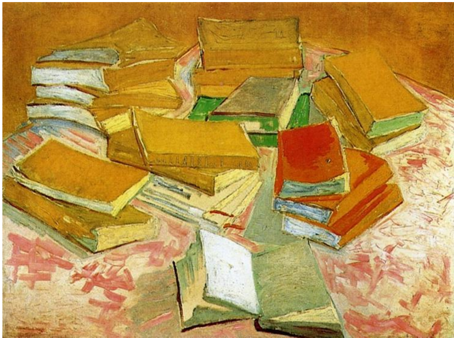
Βαν Γκογκ: Στοίβα με Γαλλικά Μυθιστορήματα