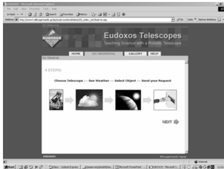
Εικόνα 2: Η πρώτη μορφή της δικτυακής πλατφόρμας η οποία επιτρέπει την από απόσταση διαχείριση του ρομποτικού τηλεσκοπίου (AM)

Το πρώτο εκπαιδευτικό εργαλείο (Εικόνα 2) μαζί με τα προτεινόμενα σχέδια μαθημάτων που το υποστηρίζουν, βρίσκεται στην ιστοσελίδα του παρόντος προγράμματος 3 . Αφορά σε δικτυακό λογισμικό το οποίο παρέχει τη δυνατότητα στους μαθητές από απόσταση να επιλέγουν τις κατάλληλες ημέρες και ώρες για παρατήρηση, να εντοπίζουν τα προς μελέτη ουράνια σώματα και να κατευθύνουν από το σχολικό τους εργαστήριο το ρομποτικό τηλεσκόπιο (AM) στις ουράνιες συντεταγμένες που έχουν επιλέξει.