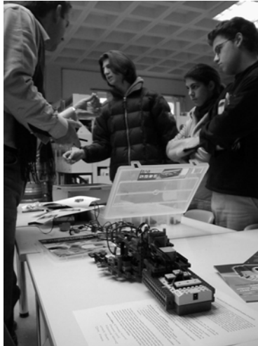
Εικόνα 3: Οι μαθητές ενημερώνονται για τις σχεδιαστικές απαιτήσεις το μοντέλου τηλεσκοπίου και δεξιά επιχειρούν τα πρώτα στάδια κατασκευής του.

Το καινοτόμο αυτό πρόγραμμα ενισχύεται με το δεύτερο εκπαιδευτικό εργαλείο που έχει προταθεί για να συμβάλει στην εποπτεία του τηλε-ελέγχου και επιπλέον εξοικείωση με το ρομποτικό τηλεσκόπιο (AM). Πρόκειται για ένα μοντέλο τηλεσκοπίου υπό κλίμακα το οποίο θα ενημερώνεται απευθείας για τις κινήσεις του ρομποτικού τηλεσκοπίου (AM) και θα κινείται ταυτόχρονα με αυτό, χρησιμοποιώντας την δικτυακή πλατφόρμα διαχείρισης.