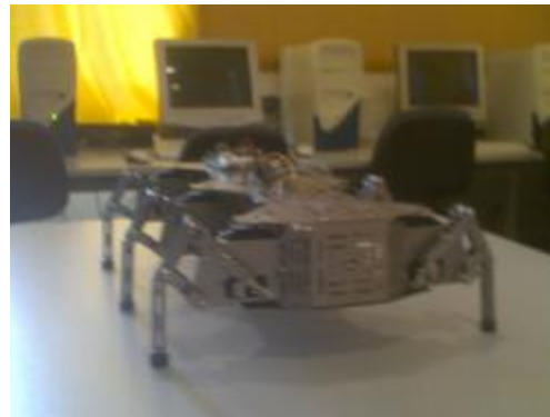
Εικόνα 2. Το ρομπότ HexCrawler Robot Kit σε βασική μορφή και το εργαστήριο υπολογιστών.