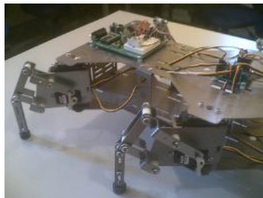
Εικόνα 4. Ο κάρτες και τα κινούμενα πόδια του HexCrawler Robot Kit