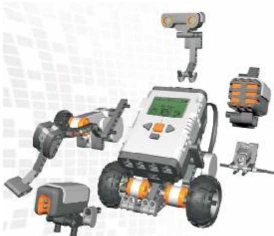
Εικόνα 1. Το ρομπότ Mindstorms NXT της LEGO