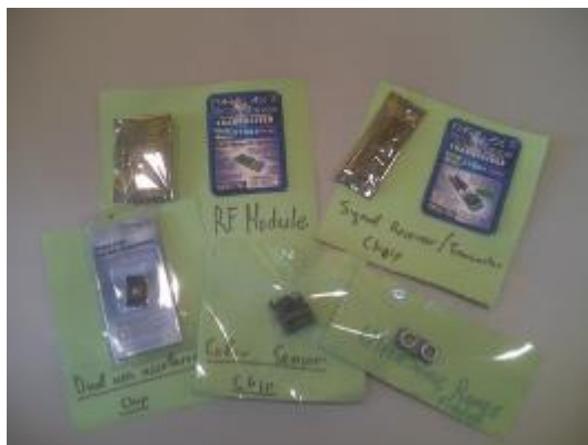
Εικόνα 3. Συσκευές εισόδου και εξόδου