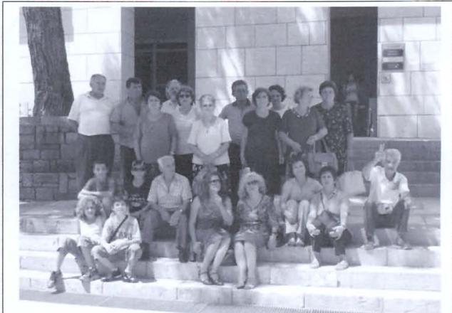
Μέρος του συνόλου των Εκδρομείων, εμπρός από το Αρχαιολογικόν Μουσείον Δελφών.