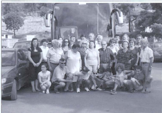
Μερικοί από τους Εκδρομείς, μπροστά από το Λεωφορείον, στο γραφικό και παραθαλάσσιον Γαλαξείδι, στην πορείαν τους για την επιστροφήν στον Καρδαμό.

Ήτανε μία εξαιρετή εκδρομή και οι εκδρομείς εξέφρασαν την επιθυμίαν τους, τέτοιες εκδρομές να γίνονται συχνότερα! -