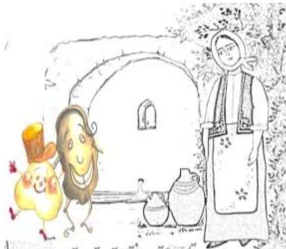
Χαλί Το κουκί και το ρεβίθι (15'')

Μια κοπέλα με παραδοσιακή φορεσιά γεμίζει τη στάμνα της. Πίσω της το κουκί και το ρεβίθι προσπαθούν να πάρει το ένα τη σειρά του άλλου. Το καθένα κρατά από ένα σακουλάκι με τα δικά του όσπρια.