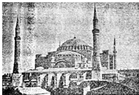
Η ΑΓΙΑ ΣΟΦΙΑ

Είναι φανερό, λοιπόν, ότι μέσω του μαθήματος της Λογοτεχνίας η Βυζαντινή Ιστορία τροφοδοτεί με τα απαραίτητα τεκμήρια την υπόθεση για τη σταθερή παρουσία του ελληνικού έθνους στο ιστορικό γίγνεσθαι, αναδεικνύοντας το Βυζάντιο ως αδιάσπαστο κρίκο του. Με την επιλεκτική ανθολόγηση που εγγράφεται στα σχολικά εγχειρίδια των Ν.Ε., από το 1884 και ιδιαίτερα μετά την κατάρρευση του μεγαλοϊδεατισμού, επιδιώκεται η οικειοποίηση των αγαθών του εθνικού μας πολιτισμού, με τρόπο που να αναδεικνύεται η ελληνικότητα. Δηλαδή, η πολιτεία πιστεύει ότι η διδασκαλία κειμένων του απώτερου ελληνοβυζαντινού παρελθόντος θα ενισχύσει τον προσδιορισμό του συνεκτικού στοιχείου της εθνικής συνείδησης.