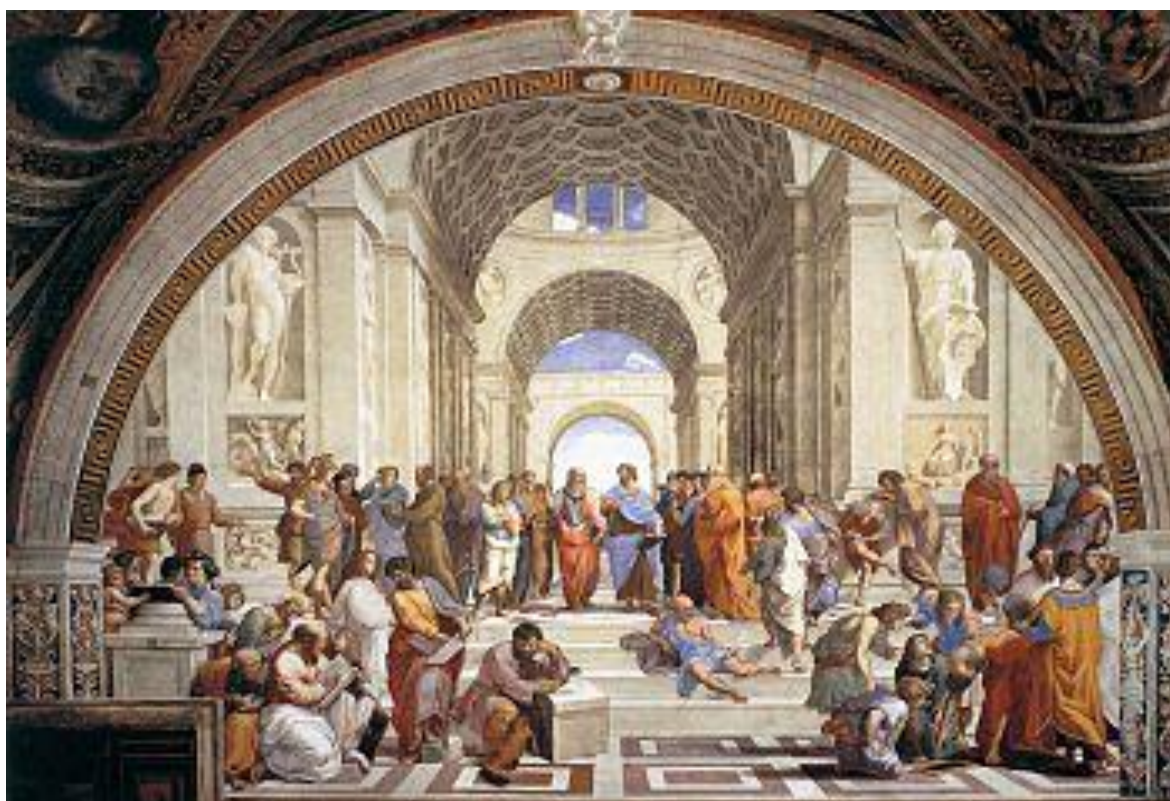
Εικαστικό έργο 5