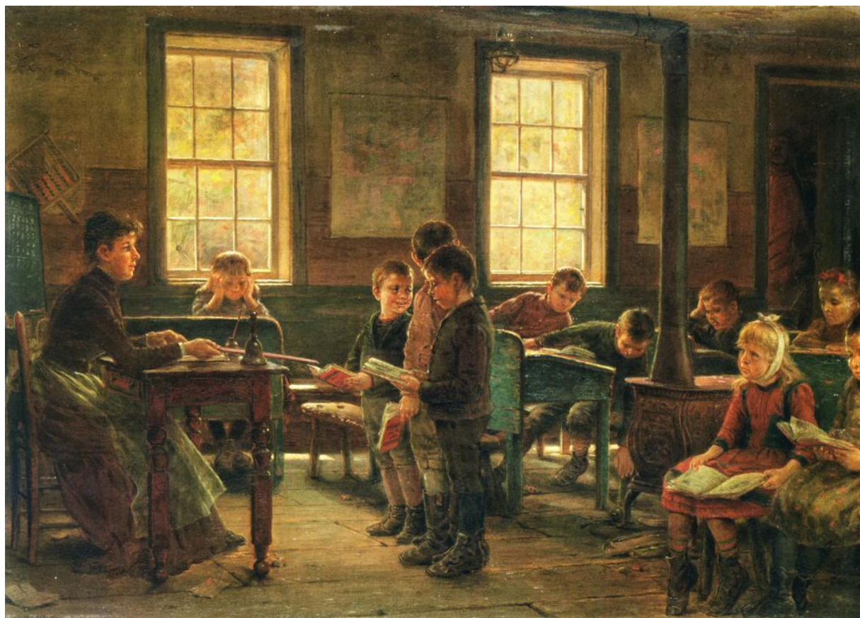
Εικαστικό έργο 4