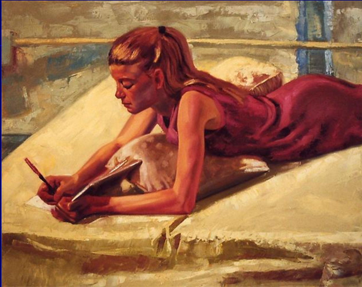
Αaron Coberly γεννήθηκε στο Σιάτλ στην Ουάσιγκτον των ΗΠΑ το 1971. Ξεκίνησε ελαιογραφία από το 1999. Το έργο του είναι κυρίως εικονιστικό με δασκάλους τους Ιμπρεσιονιστές,