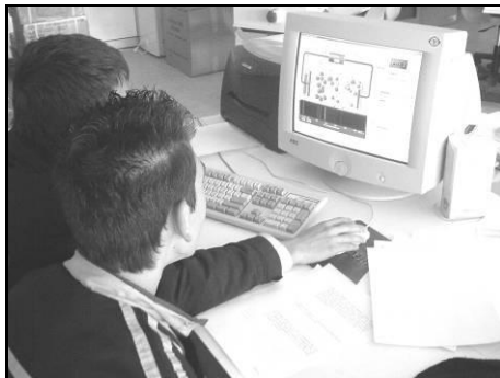
Εικόνα 1: Πιλοτική εφαρμογή του λογισμικού.

Το προτεινόμενο φύλλο εργασίας, στη μορφή που παρέχεται, καλύπτει μια ώρα δραστηριοτήτων των μαθητών/-τριών στον υπολογιστή καθώς συνεργάζονται σε μικρές ομάδες στο εργαστήριο πληροφορικής του σχολείου. Ο ή η εκπαιδευτικός μπορεί να το τροποποιήσει ανάλογα με το χρόνο που διαθέτει και τις γνωστικές ανάγκες που διαπιστώνει στους/στις μαθητές/-τριες. Προτείνεται επίσης η διανομή διαφοροποιημένων φύλλων εργασίας σε διαφορετικές ομάδες μαθητών/-τριών, ενδεχομένως και με διαφορετικά επίπεδα δυσκολίας. Το φύλλο εργασίας είναι επεξεργάσιμο, σε μορφή MS Word.