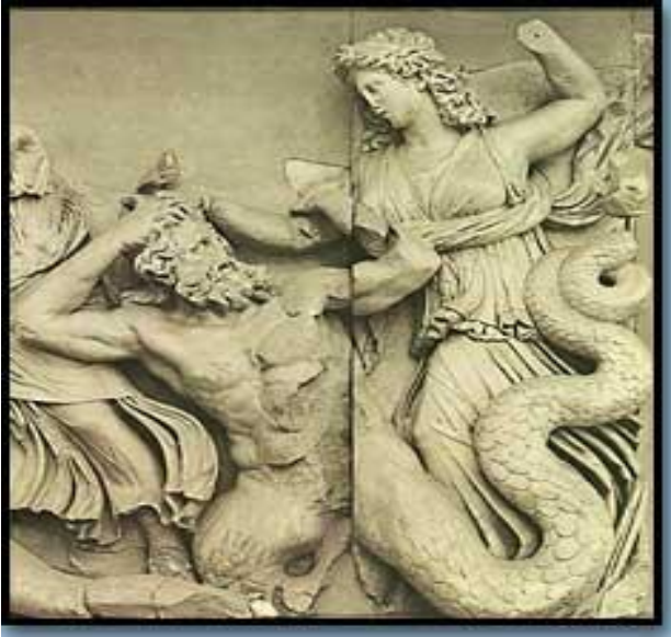
Δύο γυναικείες θεότητες, πιθανότατα οι Μοίρες, μάχονται με Γίγαντες, από τη βόρεια πλευρά της ζωφόρου.

Θεοί και Γίγαντες πολεμούν με θαλάσσια τέρατα, με πέτρες, με φίδια και με λιοντάρια, που στο σύνολο του αποτελούν πλούσια δημιουργήματα της ανθρώπινης φαντασίας. Περισσότερα από είκοσι ονόματα Γιγάντων αναγράφονται στις πλάκες της ζωφόρου, οι οποίοι στην πλειονότητα τους συνδυάζουν ανθρώπινα και τερατόμορφα χαρακτηριστικά. Τα ονόματα των θεών, τονισμένα με κόκκινο χρώμα, σώζονται ψηλά στο γείσο που περιτρέχει τη ζωφόρο. Χαραγμένα στις πλάκες βρέθηκαν και μερικά από τα ονόματα των τεχνιτών, χωρίς ωστόσο να γνωρίζουμε τον κύριο εμπνευστή του έργου.