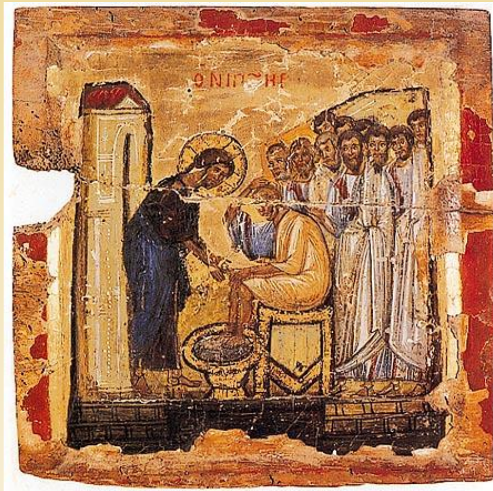
Ο Νιπτήρας α' μισό 10ου αι. Σινά, Μονή Αγίας Αικατερίνης.