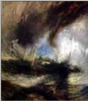
Ουίλλιαμ Τέρνερ: Ανεμοστρόβιλος, πλοίο στην είσοδο του λιμανιού

Τι μπορείς να διακρίνεις εδώ; Ποια χρώματα χρησιμοποίησε ο ζωγράφος και γιατί; Σε ποιες περιοχές έχουν παρόμοια προβλήματα το Χειμώνα;