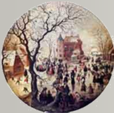
Χέντρικ Άβερκαμπ: Χειμωνιάτικη Σκηνή με Παγοδρόμους

Παρατηρούμε πίνακες ζωγραφικής, γνωστών ζωγράφων, σκεφτόμαστε, ανακαλύπτουμε και λέμε τα συναισθήματα που μας προκαλούν.