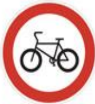
+ closed to bicycles