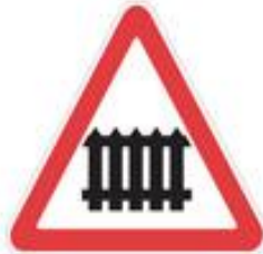
+ railroad crossing