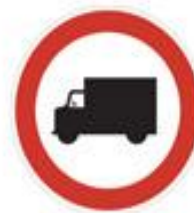
+ closed to trucks