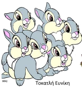
www Τοκατλή Ευνίκη