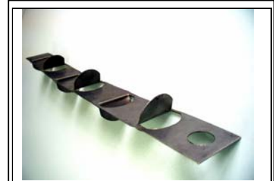
Οι πτεριγόμορφοι επιβραδυντές καυσαερίων, που χρησιμοποιήθηκαν από ελληνικό λεβητοποιείο το 1987, με προτροπή του υπογράφοντα, αύξησαν σημαντικά το βαθμό απόδοσης των χαλύβδινων λεβήτων μειώνοντας την θερμοκρασία των καυσαερίων

αναφερθούν σε κάποιο άλλο άρθρο, γιατί παρουσιάζουν πράγματι ιδιαίτερο ενδιαφέρον.