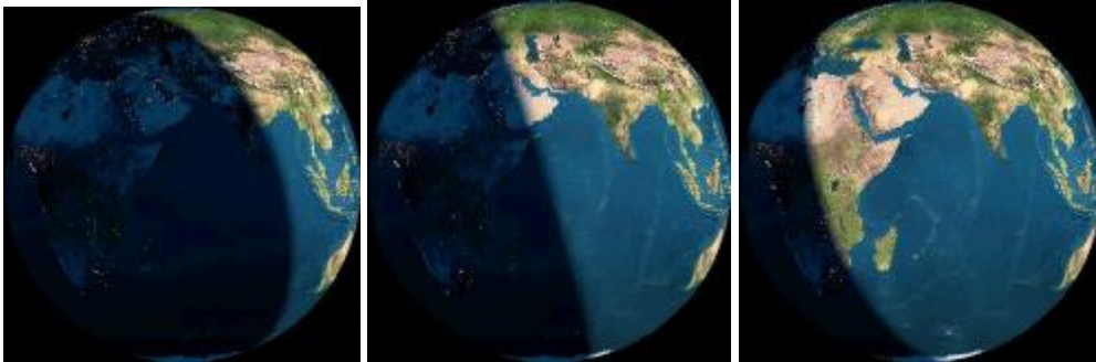
Ωρα Ελλάδος 2

α) Μας ενδιαφέρει η περιοχή της Ελλάδας. Περιγράψτε αυτό που παρατηρείτε μελετώντας προσεκτικά τις τρεις φωτογραφίες της γήινης επιφάνειας