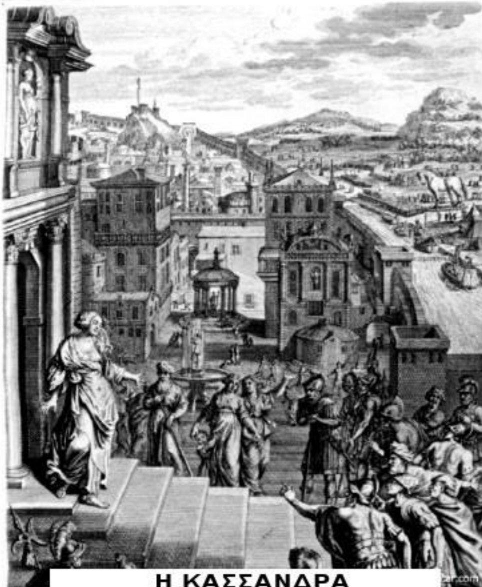
Η ΚΑΣΣΑΝΔΡΑ ΠΡΟΕΙΔΟΠΟΙΕΙ ΤΟΥΣ ΤΡΩΕΣ

Κρίνουν πως πρέπει να ανέβει στην ακρόπολη της Τροίας.