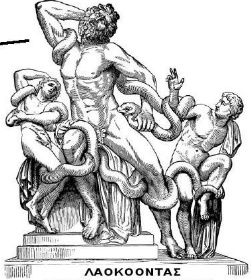
ΛΑΟΚΟΟΝΤΑΣ ΙΕΡΕΑΣ ΤΟΥ ΑΠΟΛΛΩΝΑ

Ο Ποσειδώνας στέλνει δυο φίδια τα οποία πνίγουν το Λαοκόοντα και τα παιδιά του.