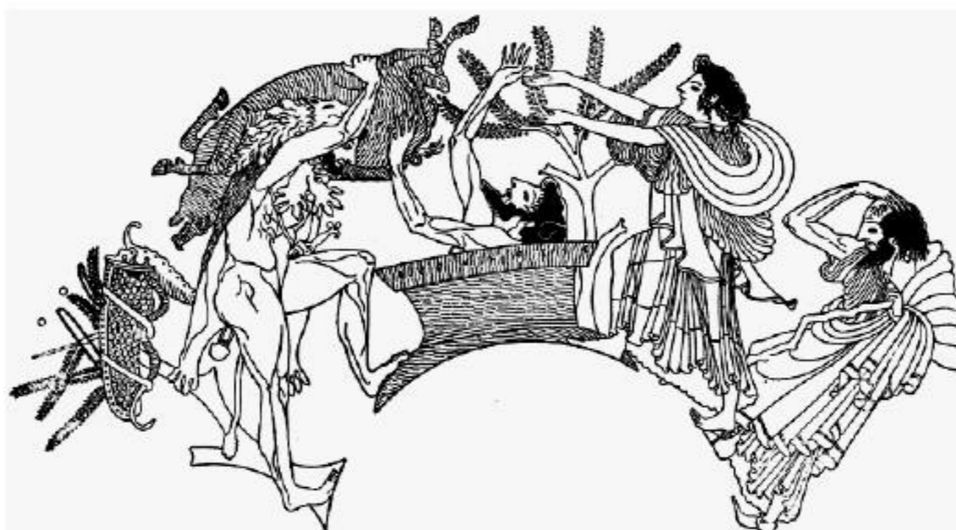
Ο Ευρυσθέας τρομάζει και κρύβεται στο πιθάρι.