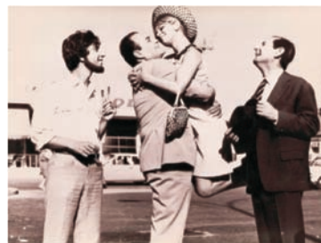
Ο Λάμπρος Κωνσταντάρας, η Αλέκη Βουγιουκλάκη και ο Σταύρος Ξενίδης σε μια φωτογραφία από την ταινία "Η κόρη μου η σοσιαλίστρια"