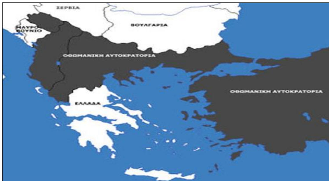
Οθωμανική Αυτοκρατορία το 1878

Με την επανάσταση του 1821 δεν ελευθερώθηκε όλη η Ελλάδα. Η Μακεδονία παρέμεινε σκλαβωμένη στους Τούρκους. Σ' αυτή τη γεωγραφική περιοχή ζούσαν Έλληνες, Βούλγαροι, Σέρβοι, Τούρκοι και πολλές άλλες εθνότητες. Το κάθε κράτος παρουσίαζε διαφορετικά στοιχεία σχετικά με τη σύνθεση του πληθυσμού.