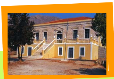
Γυμνάσιο Χάλκης - Άποψη του σχολείου