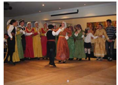
Οι Μαθητές στους Καλλιτεχνικούς Αγώνες

Το γυμνάσιο Χάλκης στεγάζεται σε ένα πέτρινο κτίριο, δωρεά των Χαλκιδών ομογενών, κυρίως, από Αυστραλία και Αμερική. Το σχολείο αριθμεί περίπου 35 μαθητές, οι οποίοι πέρα των μαθημάτων τους ασχολούνται με τη μουσική και τον χορό. Η αγάπη και ο ζήλος των μαθητών για τον χώρο αποδεικνύεται έμπρακτα και από το γεγονός ότι κάθε χρόνο λαμβάνουν μέρος στους Πανελλήνιους Μαθητικούς Καλλιτεχνικούς Αγώνες καταλαμβάνοντας πολλές φορές την πρώτη θέση, όπως και φέτος.