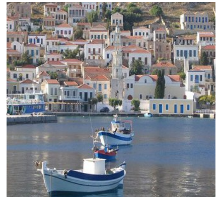
Άποψη του λιμανιού της Χάλκης

Στο Νημποριό μπορεί κανείς να θαυμάσει τα διόρωφα πέτρινα σπία με τις κεραμιδένιες στέγες χτισμένα αμφιθεατρικά στις πλαγιές του ομώνυμου κόλπου. Ενώ, σε όλο το νησί μπορεί κανείς να επισκεφτεί τα αναριθμητά εκκλησάκια και επιβλητικά μοναστήρια, που θυμίζουν την εποχή της ευημερίας του νησιού.