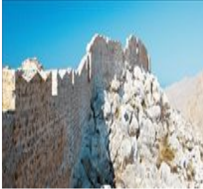
Το Ενετικό Κάστρο

Μια παράδοση αναφέρει ότι το όνομα Χάλκη προέρχεται από τα ορυχεία χαλκού , που υπήρχαν στο νησί. Ενα μεσαιωνικό έγγραφο αναφέρει για τη Χάλκη ότι ‘σώζονται δε μέχρι τού νυν αβλαβείς και οι μέταλλα ταύτα έχοντες τόποι’ . Δεν αναφέρει ειδικά για χαλκό ή αν το νησί πήρε το όνομά του από το χαλκό. Σήμερα, δεν υπάρχει ίχνος χαλκού ή ορυχείου στη Χάλκη. Μια άλλη παράδοση μας πληροφορεί ότι το όνομα της Χάλκης προέρχεται από τη φοινικική ονομασία της κογχύλης «καρκί» , που βρισκόταν σε αφθονία στις βραχώδεις ακτές