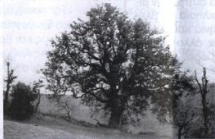
Το πουρνάρι, πριν πέσει

(Το άρθρο αυτό αναδημοσιεύεται, γιατί από τις 29 Νοεμβρίου 2010, το πουρνάρι δεν υπάρχει, έπεσε, το γκρέμισε ένας δυνατός αέρας, δεν άντεξε.... Κάποιοι, πριν από μερικά χρόνια, τρύπησαν επικίνδυνα τον κορμό του μέχρι το κέντρο του, για να εξακριβώσουν, όπως είπαν, την ηλικία του και από τότε άρχισε το τέλος της ζωής του...Οι προγονοί μας διέσωσαν αυτό το ιερό σύμβολο της ιστορίας του χωριού .... Εμείς, οι απόγονοί τους, αφήσαμε κάποιους, κάποιους ασυνείδητους, να το κακοποιήσουν..., κριτές μας, οι νεκροί και οι αγέννητοι του χωριού μας.... κριτές σκληροί, και δικαίως... Και τώρα μια πρόταση: ένα κομμάτι του κορμού του πουρναριού, πρέπει να μεταφερθεί και να εκτεθεί στο Μουσείο μας, να διασωθεί..., ας το φροντίσουν, αυτό, ο Δήμος, ο Σύλλογος...).