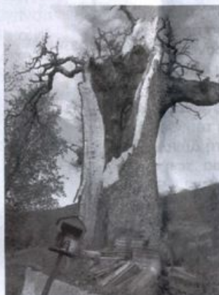
Το πουρνάρι, σήμερα