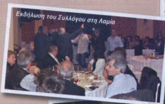
Εκδήλωση του Συλλόγου στη Λαμία

Καλό Πάσχα και καλή ανάπτυξη στο Δίκαστρο