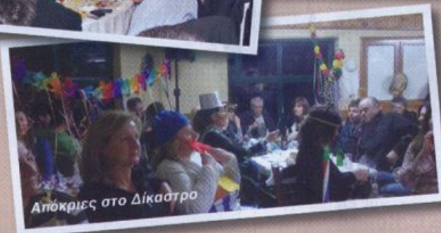
Απόκριες στο Δίκαστρο