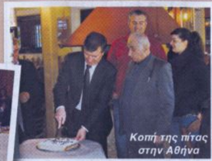
Κοπή της πίτας στην Αθήνα