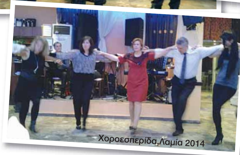
Χοροεσπερίδα, Λαμία 2014