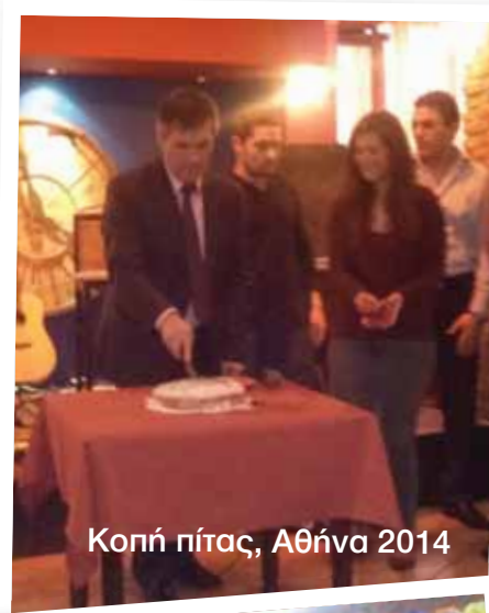
Κοπή πίτας, Αθήνα 2014