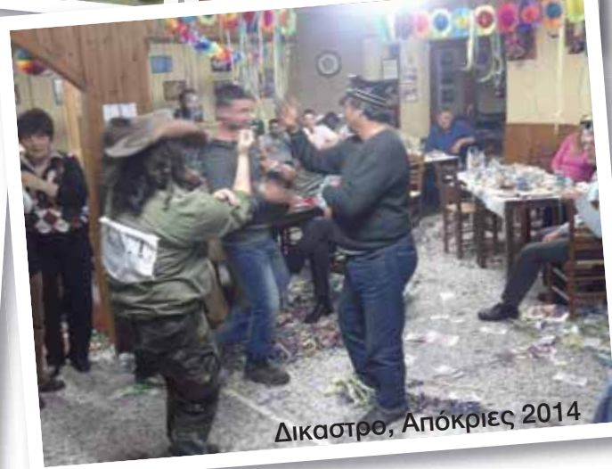
Δίκαστρο, Απόκριες 2014