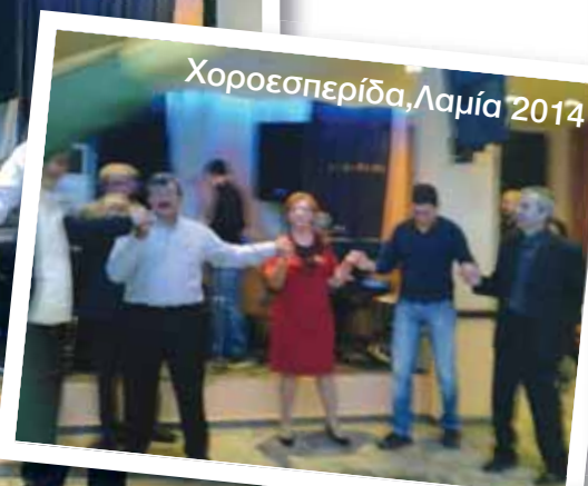
Χοροεσπερίδα, Λαμία 2014