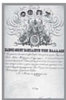
Δίπλωμα αριστείου ανδρείας

Από τους Ονομαστικούς Καταλόγους αριστειούχων πολεμιστών 1821, προκύπτει, ότι απονεμήθηκαν: (i) στους Αξιωματικούς Αργυρά