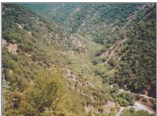
Το ρέμα του Βέλη ή Βελή.

Όλες οι οικογένειες της Ζημιάνης, και οι 21, ανταποκρίθηκαν στην πρόσκληση του Κώστα Βελή και έπραξαν το υπέρτατο χρέος τους προς την πατρίδα. Έστειλαν αμέσως τα παιδιά τους, όλα τα παιδιά της Ζημιάνης, ηλικίας 20 μέχρι 30 ετών, εν συνόλω 32, να ενταχθούν στον «Νταϊφά» (στρατό ατάκτων) του Αρματολού Κώστα Βελή, να γίνουν απαίδευτοι αγωνιστές και να πολεμήσουν, με ακατανίκητη ψυχή και με σύνθημα, ελευθερία ή θάνατος, για την ελευθερία της πατρίδας από την τουρκική τυ-