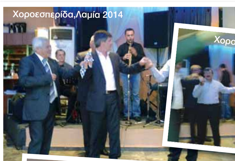
Χοροεσπερίδα, Λαμία 2014

Οι Δικαστριώτες και οι φίλοι του χωριού μας, έδειξαν με την παρουσία τους ότι ξέρουν και μπορούν να συμμετέχουν, να ανταμώνουν και να γλεντάνε. Και του χρόνου ακόμη καλύτερα!