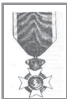
Αριστείο ανδρείας (Αργυρό, χάλκινο, σιδερένιο)

προς την πατρίδα κατά τον ιερόν αγώνα της ανεξαρτησίας και για την ανδρεία τους», (ii) Διπλώματα «ως εντίμως μεθέξαντες του υπέρ της ανεξαρτησίας των Ελλήνων αγώνος» και (iii) η Αδεια «να φέρωσι τα έντιμα παράσημά των εις πάσαν περίστασιν».