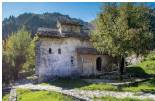
Η Ιερά Μονή Σέλτσου

Στις 16 Δεκεμβρίου οι Σουλιώτες χωρίστηκαν σε τρεις φάλαγγες και εγκατέλειψαν το Σούλι. Η πρώτη φάλαγγα υπό τον Φώτο Τζαβέλα διαπεραιώθηκε στην Κέρκυρα, η δεύτερη φάλαγγα, υπό τους Κίτσο και Νότη Μπότσαρη και Κουτσονίκα, κατευθύνθηκε προς τα Άγραφα και τον Τυμφρηστό και η τρίτη φάλαγγα δέχθηκε επίθεση στο Ζάλογγο και εξοντώθηκε (ολοκαύτωμα Κιούγκι, χορός Ζαλόγγου).