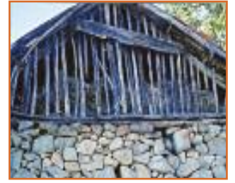
Αχυρώνας ή Καλύβα

Τα καινούργια σπίτια, σήμερα και στο Δίκαστρο, είναι θερινές κατοικίες των οικογενειών, είναι σπίτια αστικής ζωής, χωρίς κατώ, χωρίς οικιακή (κτηνοτροφική και αγροτική) οικονομία. Είναι σπίτια σύγχρονα, σπίτια του 21ου αιώνα, που κτίζονται από αρχιτέκτονες και πολιτικούς μηχανικούς και εξαρτώνται, από τις αγορές, λαϊκές και πολυεθνικές.