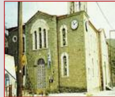
Η εκκλησία του Αγίου Γεωργίου (Πανηγύρι, τ' Αιγιοργιού)