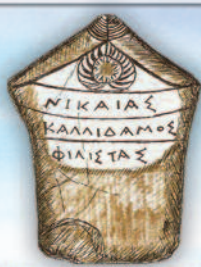
Επιτύμβια στήλη Δικάστρου (3ος -2ος αιώνας π. Χ.)