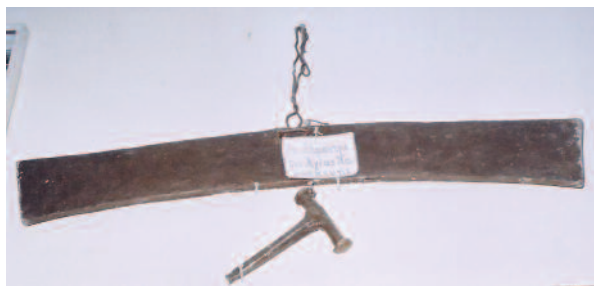
Το σήμαντρο του εξωκλησιού της Αγίας Παρασκευής

• Η τοποθεσία και η δυτική περιοχή του χωριού, οι οποίες είναι επισφαλείς και το έδαφος τους υφίσταται κατολισθήσεις, για να προστατεύει η μεγαλομάρτης Αγία Παρασκευή τα γόνιμα χωράφια(αμπέλια, σιτάρια, κα-