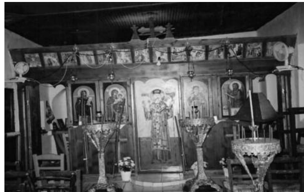
Το Τέμπλο του εξωκλησιού Αγίας Παρασκευής

• Όταν ο Ταράσιος, διοικητής μιας άλλης πόλης στην οποία επίσης κήρυττε η Παρασκευή, έδωσε εντολή να την συλλάβουν και να την βασανίσουν και οι στρα-