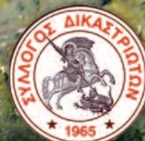
Άγιος Γεώργιος Δικάστρου Πολιούχος Άγιος της Κοινότητας (1525) Προστάτης Άγιος του Συλλόγου (1965)

ΤΡΙΜΗΝΙΑΙΑ ΕΝΗΜΕΡΩΤΙΚΗ ΕΚΔΟΣΗ ΤΟΥ ΣΥΛΛΟΓΟΥ ΤΩΝ ΑΠΑΝΤΑΧΟΥ ΔΙΚΑΣΤΡΙΩΤΩΝ