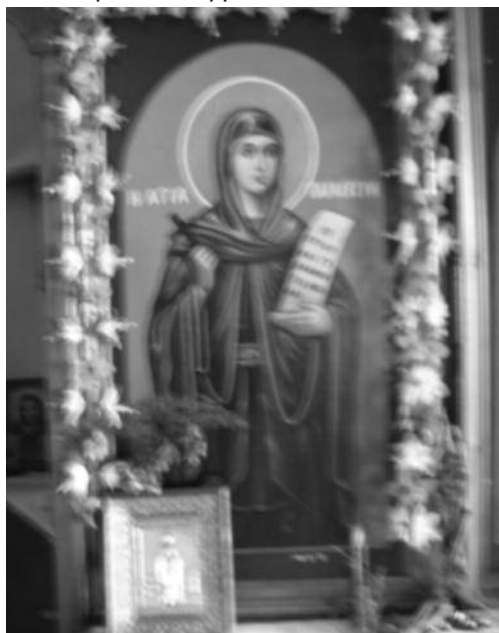
Η Εικόνα της Αγίας Παρασκευής, στο Τέμπλο του εξωκλησιού

Σε ηλικία των 20 ετών, οι γονείς της πέθαναν και αποφάσισε να πωλήσει την περιουσία της και να διαθέσει το αντίτιμο στους φτωχούς, στις χήρες και στα ορφανά και στο κοινό Χριστιανικό Ταμείο, το οποίο βοήθουσε τις γυναίκες που ήταν αφιερωμένες στα έργα της ελεημοσύνης και στη διάδοση του Ευαγγελίου.