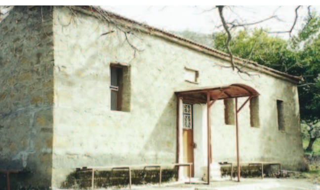
Το Εξωκλήσι της Αγίας Παρασκευής