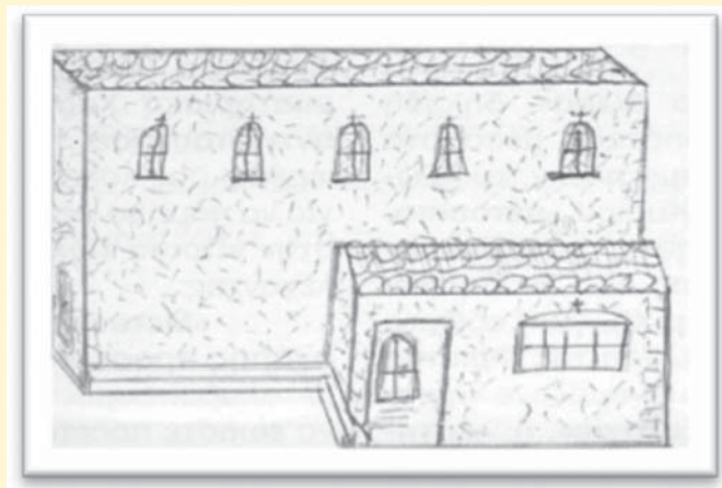
Ο Ναός της Μονής του Αγίου Γεωργίου Ζέμιανης, με το Παρεκκλήσι του Αγίου Χαράλάμπος. (Σχεδιάγραμμα στρατηγού-ιατρού Δημητρίου Γ. Παπαδημητρίου)

Ήταν Μονή, καθώς σε αυτή εγκαταστάθηκαν οι ιερείς και οι μοναχοί από τους εγκαταλειμμένους Ναούς και Μονές των πεδινών οικισμών της επισκοπής Υπάτης, αλλά και Ενοριακός Ναός για τις λειτουργικές και λατρευτικές ανάγκες των κατοίκων, «εν καιρώ πολέμου» κατά των Τούρκων.