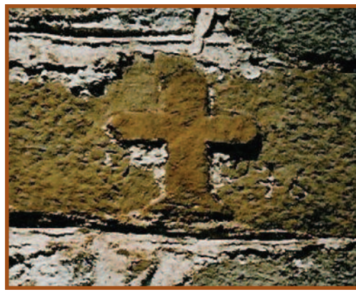
Σταυρός, φυλαχτό, στο σπίτι των Δημ. και Κων. Κούκιου, στο Δίκαστρο

ζουν οι χριστιανοί κατά τις προσευχές, τις παρακλήσεις, τις δεήσεις, τις ευχαριστίες τους προς το Θεό και τους Αγίους.