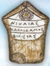
Επιτύμβια στήλη Δικάστρου