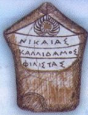
Επιτύμβια στήλη Δικαστρου