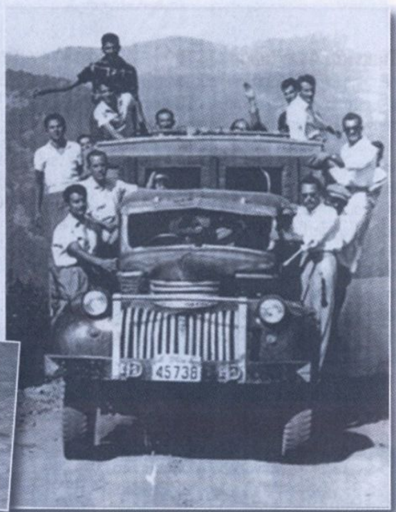
Ο Προβιάς, στον Αι-Γιάννη Ζιώψης, έρχεται... κάποιος θα αναγνωρίσει τον εαυτόν του...