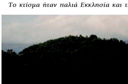
Το κάστρο κουτσο-Νίκα, δυτικά το παλιοκκλήσι

Μια τοποθεσία στη δυτική παρυφή του κάστρου κουτσο-Νίκα έχει την τοπωνυμία «Παλιοκκλήσι» και μια άλλη παρακείμενη έχει την τοπωνυμία «Παπάδες». Σήμερα, στις τοποθεσίες διασώζονται πέτρες από κτίσμα, τμήμα αρχαίου τείχους με μεγαλίθους, πηγή νερού και μια μικρή συστάδα από ψηλά δέντρα, βελανιδιές. Οι ετυμολογίες των τοπωνυμίων παραπέμπουν σε τοποθεσίες, όπου υπήρχε παλιά Εκκλησία και όπου διέμεναν Παπάδες (ιερείς).