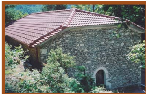
Η Εκκλησία της Παναγίας στον «πέρα-Μαχαλά» Δικάστρου