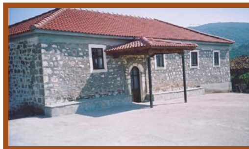
Η Εκκλησία των Αγίων Σεραφείμ, στο «Κοτρώνη» Δικάστρου

Από το 1525, σύμφωνα με τους όρους της Συνθήκης Αυτονομίας Αγράφων-Τυμφρηστού, οι κάτοικοι των τριών οικισμών της Ζημιανής συναθροίστηκαν και συγκρότησαν την Κοινότητα Ζημιανής, για να είναι αυτόνομοι και αυτοδιοίκητοι (να εκλέγουν τους Άρχοντές τους, Δημογέροντες και Προεστούς), υπό τον όρο της πληρωμής φόρου υποτέλειας στους Τούρκους. Η παράδοση του χωριού, αναφέρει, ότι «στους πρώτους αιώνες της Τουρκοκρατίας, οι κάτοικοι της Ζημιανής ξεπερνούσαν τις 300 οικογένειες».