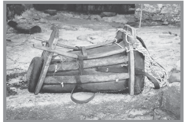
Σαμάρι, μουλαριού (2002), σαμάρουαν του μπλάρ' τ' Γιάν' τ' Καρφή