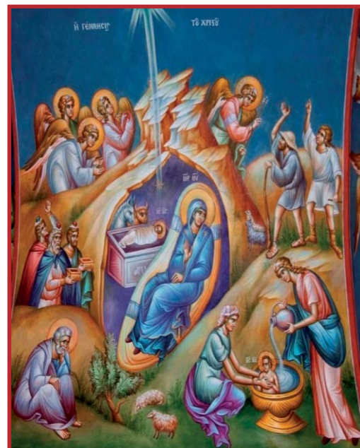
Η Γέννησις του Χριστού (Χείρ παπα Σταμάτη Σκλήρη)

ορισμένες περιοχές, όπως σε αυτές τις Λοκρίδας, το "τσικνίζουν". Μετά το τέλος της Θείας Λειτουργίας, τα ξημερώματα των Χριστουγέννων, ανάβουν τις φωτιές και πριν ακόμα βγει ο ήλιος, έχουν ήδη στήσει το Χριστουγεννιάτικο τραπέζι, με χοιρινά και μεζέδες.