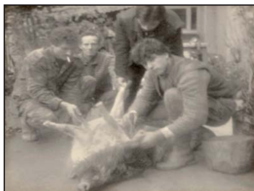
Σφάξιμο του γουρουνιού

Στα χωριά της Δυτικής Φθιώτιδας, του Δομοκού, της Παρνασσίδας και της Δωρίδας, η "σφαγή των χοίρων", η λεγόμενη "χοιροσφαγή", παίρνει ένα εντελώς διαφορετικό χαρακτήρα. Σχεδόν σε κάθε σπίτι υπάρχει γουρούνι. Οι κάτοικοι και οι προσκεκλημένοι σε ομάδες ξεκινούν το σφάξιμο από σπίτι σε σπίτι. Μάλιστα προσδίδουν ένα τελετουργικό στην "χοιροσφαγή". Είναι απαραίτητο να υπάρχει φωτιά και ζεστό νερό, να υπάρχει κάρβουνο και λιβάνι και την ώρα που γίνεται