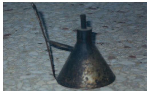
Καντήλι (Φωτιστικό των σπιτιών Δικαστρου) Μουσείο Δικαστρου