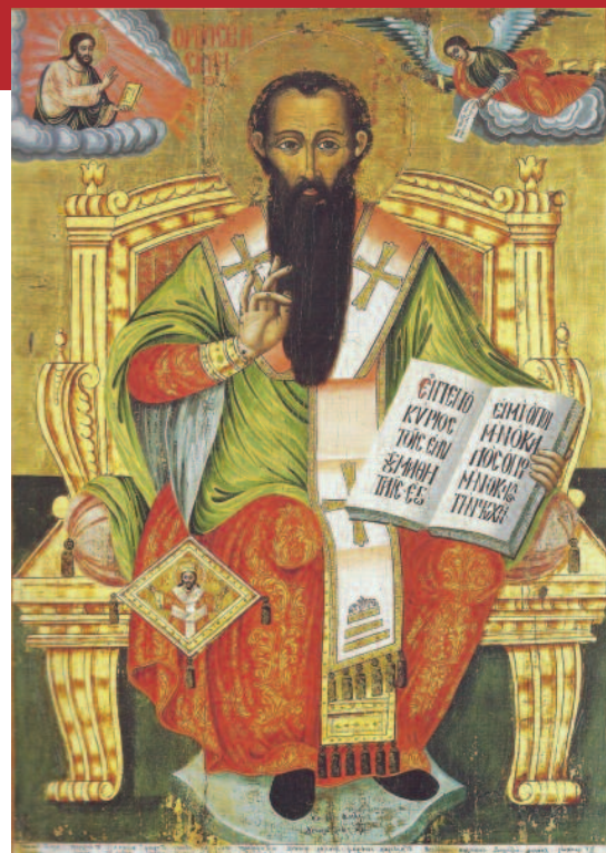
Άγιος Βασίλειος, ο Μέγας (Εικόνα στον Άγιο Γεώργιο Δικαστρού)