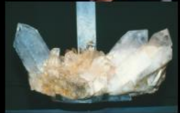
Διαφανής χαλαζίας για High-Tech