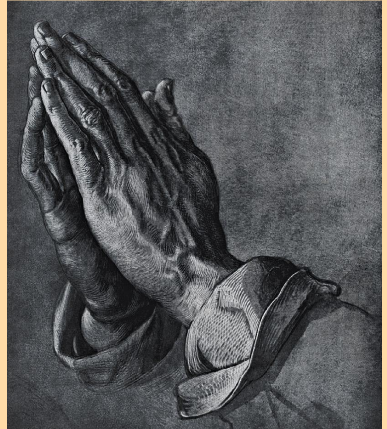
Χέρια προσευχής, Ντύρερ

Λοιπόν η ικανοποίηση εξαρτάται και από το είδος των αιτημάτων.