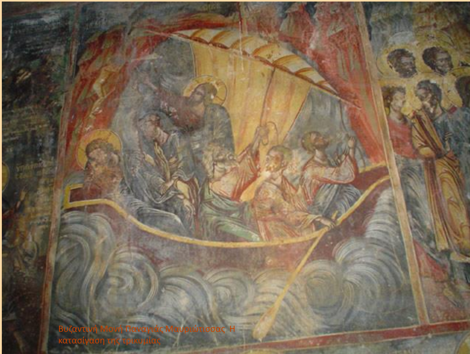
Βυζαντινή Μονή Παναγίας Μαυριώτισσας Η κατασίγαση της τρικυμίας

«Υπὲρ πλεόντων, ἵπταμένων, ὄδοιπορούντων, νοσοούντων, καμνόντων, αἰχμαλώτων καὶ τῆς σωτηρίας αὐτῶν τοῦ Κυρίου δεηθῶμεν». Από τη θεία Λειτουργία