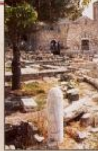
Η σπιλή του Αποστόλου Παύλου στον περιβόλι της Αγίας Κοριακής Χριστοπόλιτοσας