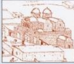
Η Μονή του Αποστόλου Βαρνάβα στην Κύπρο (χαρακτικό του Ρώσου περιηγητή Βασίλι Μπαρόκι)