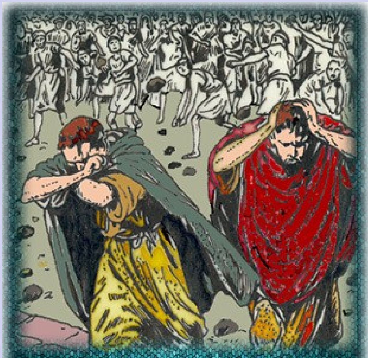
Λιθοβολισμός στα Λύστρα