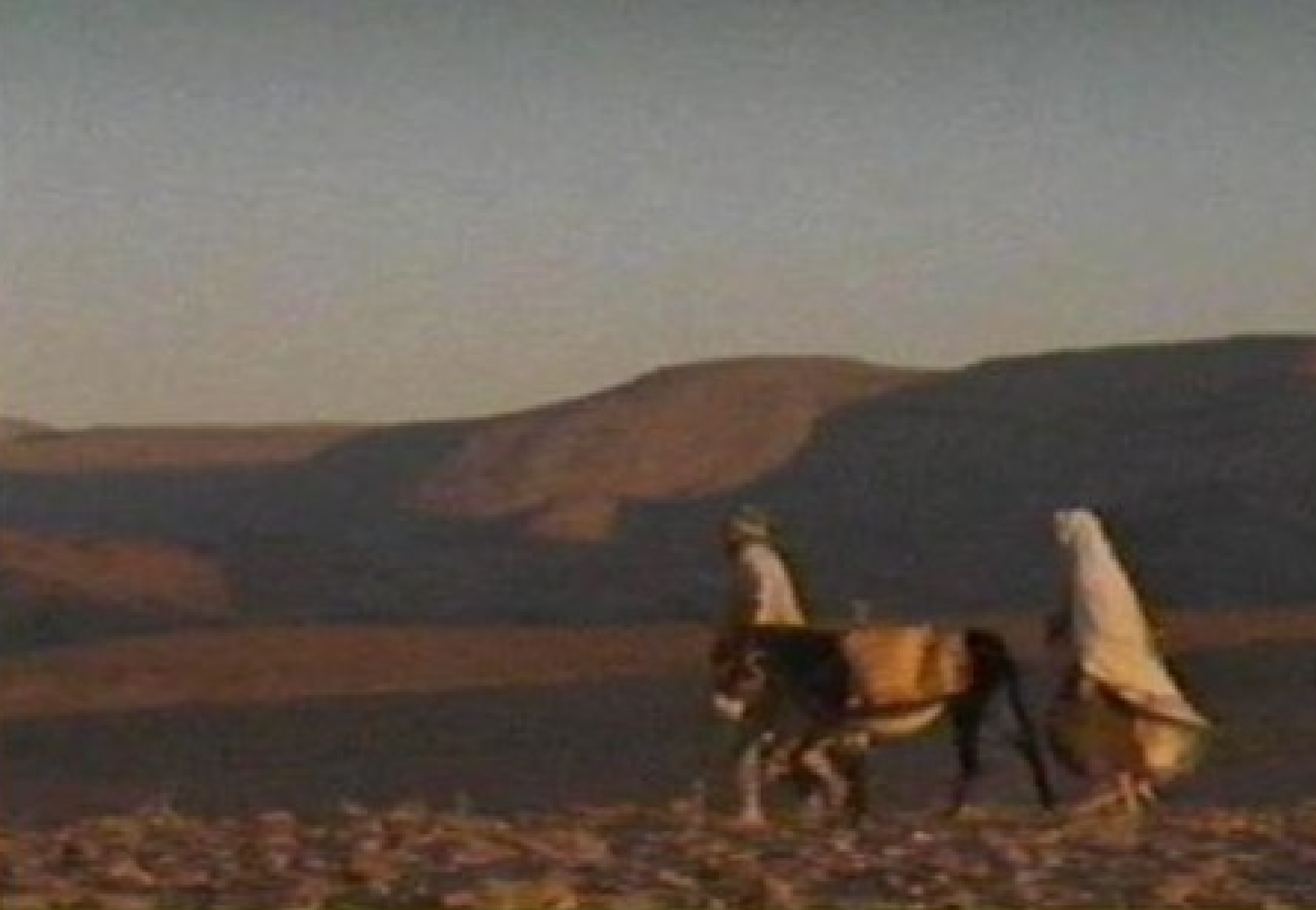
Paul and Barnabas travel overland (historical re-creation).