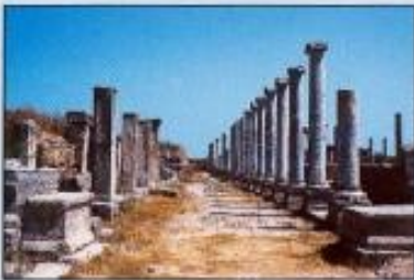
Η ρωμαϊκή πύλη και, στο βάθος, η ελληνιστική πύλη της Πέργης