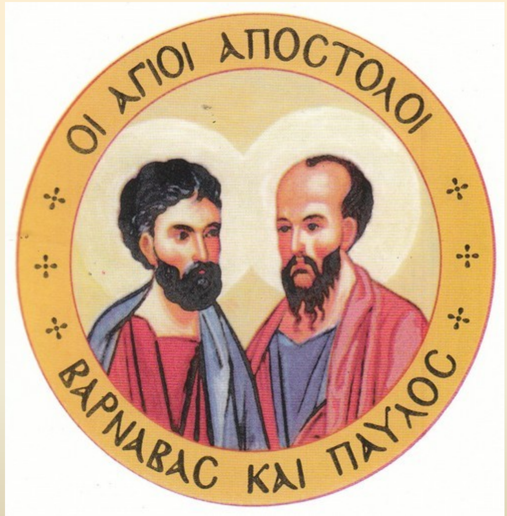
Οι άγιοι απόστολοι Παύλος και Βαρνάβας