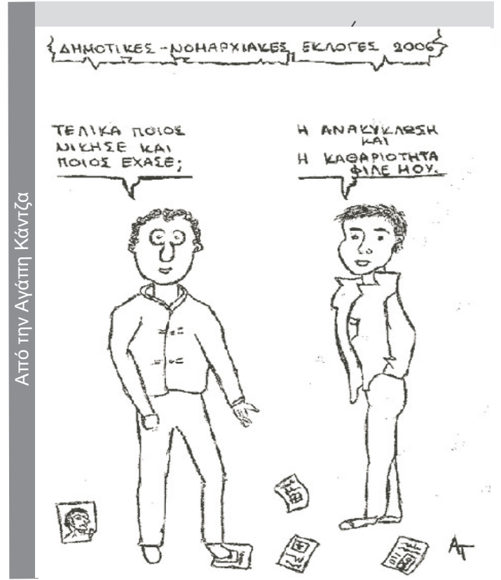
Από την Ανάπη Κάντζα

Ο Παναθηναϊκός συνέχισε τις εξαιρετικές του εμφανίσεις πανηγυρίζοντας μια ακόμη νίκη. Οι "πράσινοι" έπαιξαν ως πρωταθλητές στην Ορεστιάδα, και με εξαιρετική