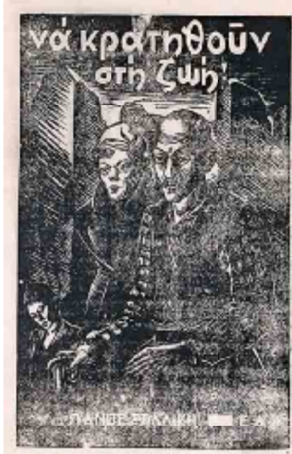
Αφίσα του ΕΑΜ