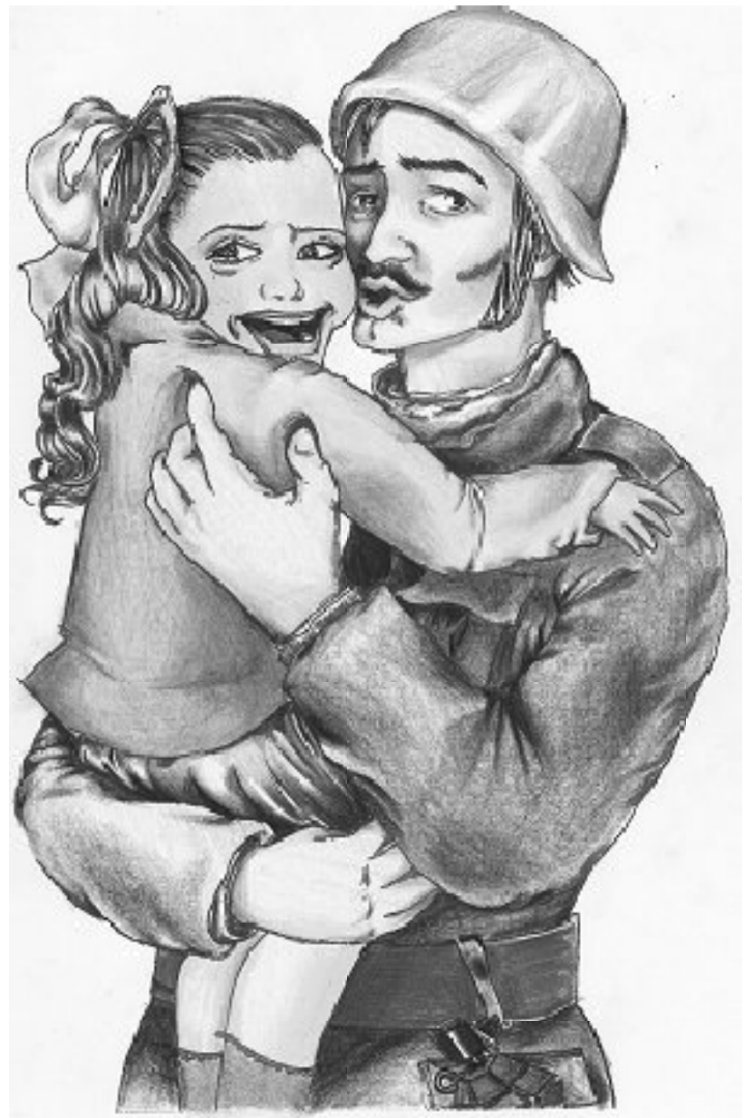
Ζωγραφική από την Πηνελόπη Παπαδη ητράκη

Και οι δύο πέρυσι βραβεύτηκαν από την Ακαδημία Αθηνών για την προσφορά τους στην εθνική αντίσταση.