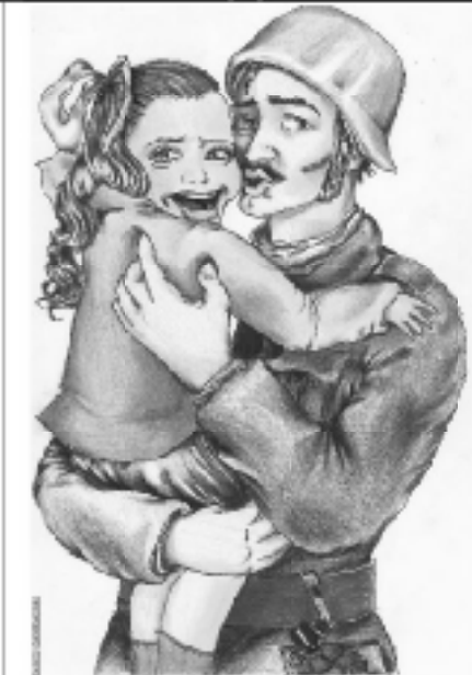
Πειραματικό Λύκειο Ευαγγελικής Σχολής Σμύρνης