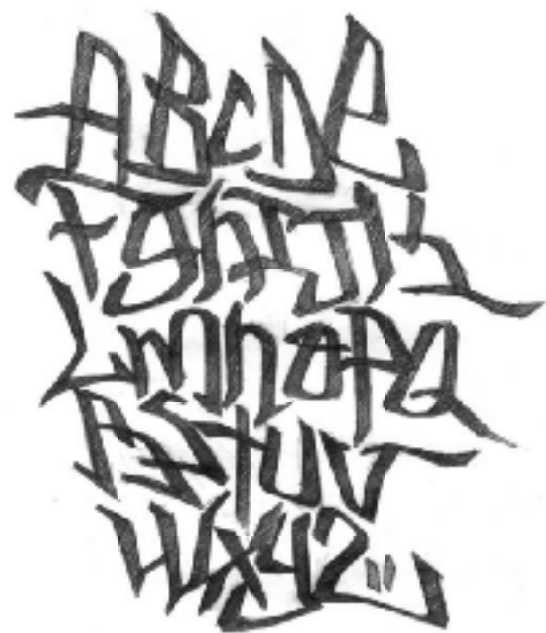
Αλφάβητο του Graffiti