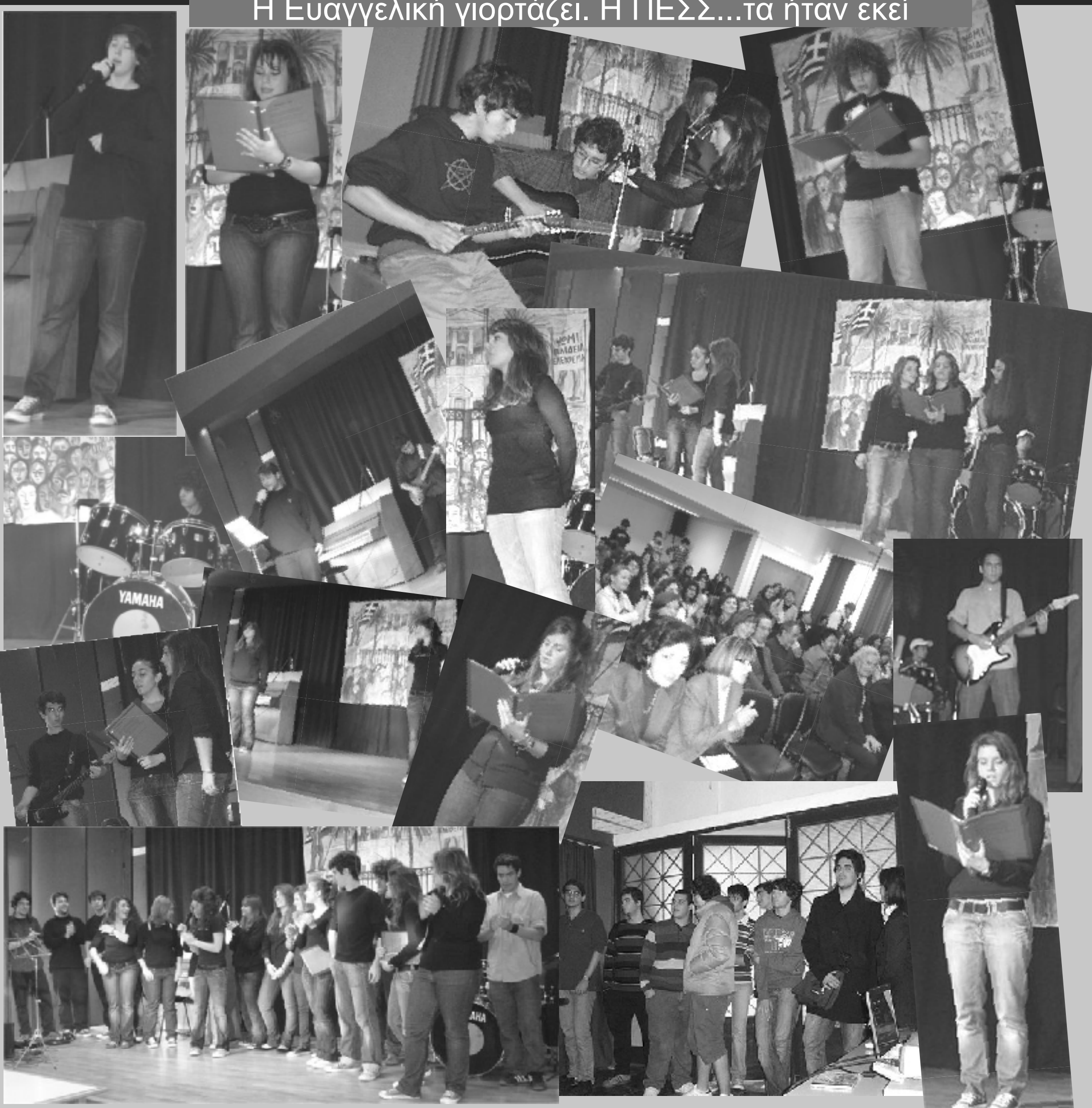
Από τον εορτασμό της Εορτής της 17ης Νοεμβρίου