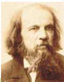
D. Mendeleev (1834-1907). Στο βιβλίο του «Αρχές Χημείας» συστηματοποίησε τις ιδέες του και επινόησε τον περιοδικό πίνακα ταυτόχρονα με το Γερμανό Λ. Μάγιερ.

Στη μουσική μια οκτάβα περιλαμβάνει επτά διαφορετικές νότες και μια όγδοη που είναι ίδια με την πρώτη.