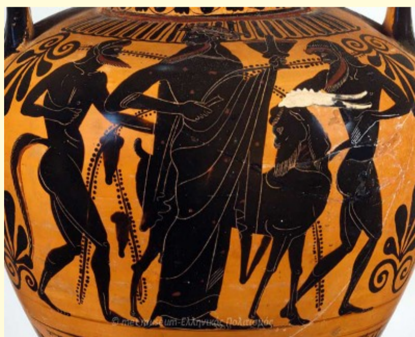
Αμφορέας, 510-500 π.Χ. met museum

Στο κέντρο της σύνθεσης ο Διόνυσος κρατώντας κώνθαρο. Αριστερά και δεξιά του δύο Σάτυροι. Το διαφορετικό σ' αυτήν την παράσταση είναι η κασίκα, δίπλα στο Διόνυσο, που έχει πρόσωπο Σάτυρου.