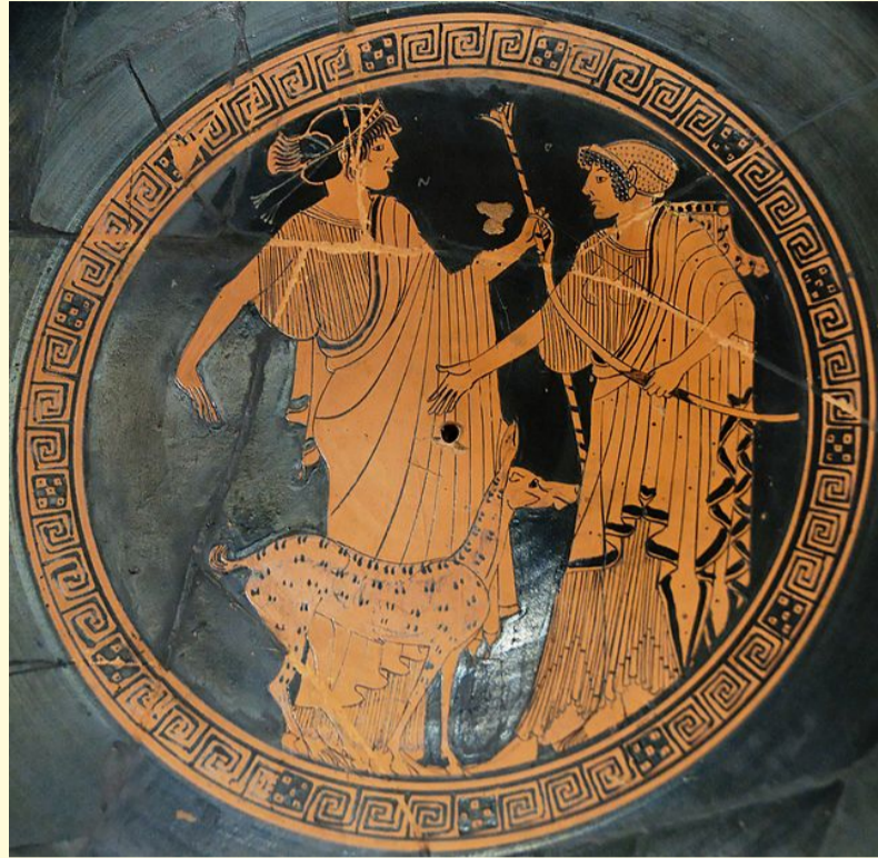
Άρτεμις και Απόλλων. Αττική Κύλικα, 470 π.Χ. Αγγειοπλάστης Βρύγος, Λούβρο.

Ο διθύραμβος ήταν θρησκευτικό και λατρευτικό άσμα που τραγουδούσε ο ιερός θίασος των πιστών του Διονύσου, με συνοδεία αυλού, χορεύοντας γύρω από το βωμό του θεού. Ο ύμνος αυτός είναι πολύ πιθανό ότι περιείχε επιπρόσθετα μια αφήγηση σχετική με τη ζωή και τα παθήματα του θεού. Την απόδοση της αφήγησης αναλάμβανε ο πρώτος των χορευτών, ο εξάρχων, που έκανε την αρχή στο τραγούδι, ενώ Χορός 50 χορευτών, μεταμφιεσμένων ίσως σε τράγους, εκτελούσε κυκλικά (κύκλιοι χοροί) το διθύραμβο. Στην αρχή ο διθύραμβος ήταν αυτοσχέδιος και άτεχνος. Από την αυτοσχέδια αυτή μορφή των λαϊκών λατρευτικών εκδηλώσεων