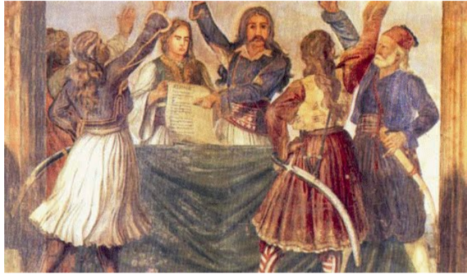
[τοιχογραφία στη Βουλή]

Μια από τις πιο μαύρες σελίδες στην ιστορία της Ελλάδας είναι αυτή του Εμφυλίου Πολέμου της περιόδου 1823 – 1825. Ο πόλεμος αυτός είχε βαρύτατο κόστος για τη χώρα και παραλίγο να πλήξει ανεπανόρθωτα την Ελληνική Επανάσταση που τότε βρισκόταν ακόμα σε εξέλιξη. Ο Εμφύλιος χωρίζεται σε Α' φάση και Β' φάση.