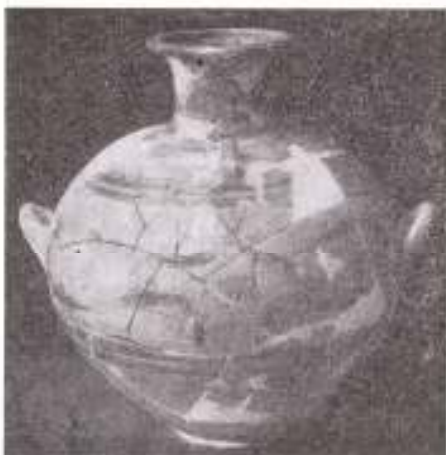
Εικ. 5. Ἀγγεῖον σχήματος ἰδρύας ἐκ τοῦ θολωτοῦ τάφου.