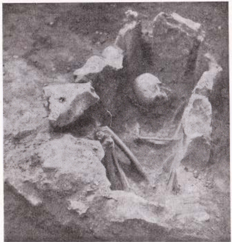
Εικ. 4. Ὁ εἰς τῶν μεσοελλαδικῶν τάφου μετὰ τοῦ ἐν αὐτῇ νεκροῦ.