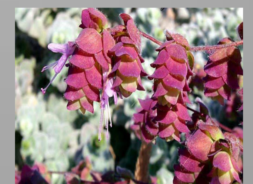
Δίκταμο - Έρωντας