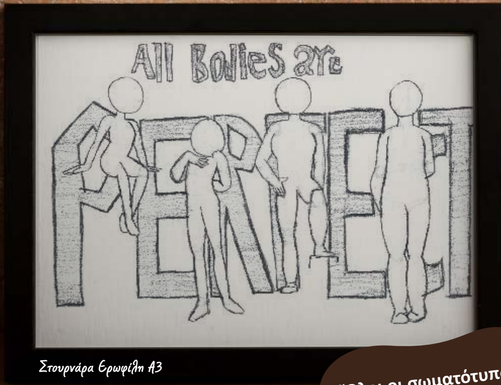
Στουρνάρα Ερωφίλη Α3

“Όλοι οι σωματότυποι είναι τέλειοι...” (all bodies types are perfect)