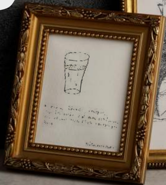
Αλέξανδρος Μαρκέας Α2

(If you are going through difficult times, drink a glass of water, take a deep breath and think a little.)