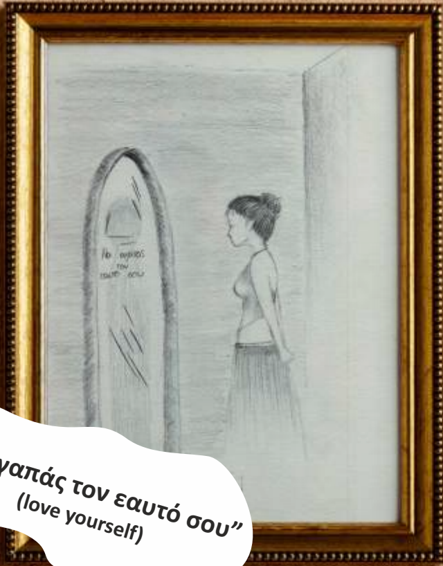
Παπασιφάκη Μελίνα Α3

“Ακολούθα ελεύθερα την καρδιά σου” (Follow your heart freely)