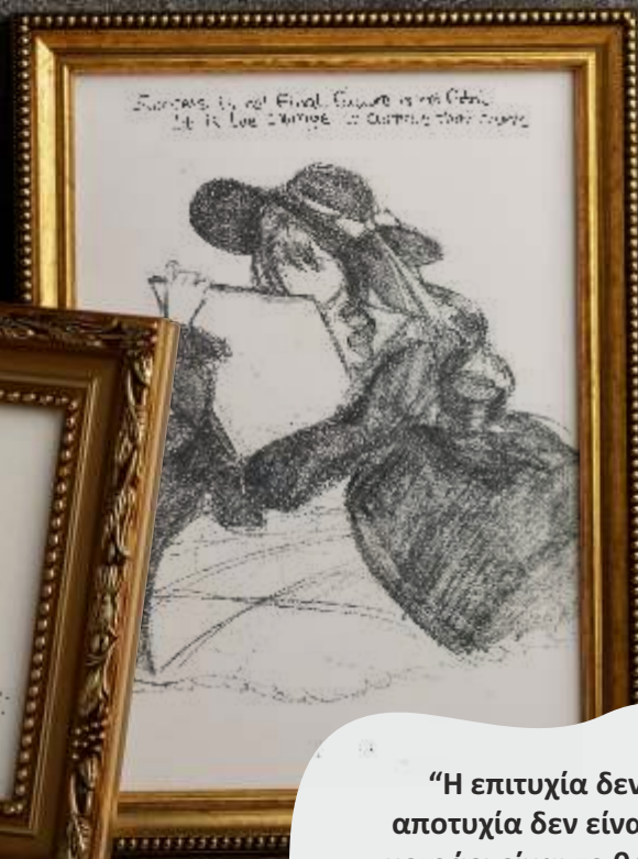
Γιανναράκη Νικολέτα Π1